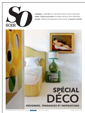
VUE SUR L'UNE DES CHAMBRES DE L'HÔTEL PARTICULIER IXELLOIS REDÉCORÉ PAR SA NOUVELLE PROPRIÉTAIRE, VICTORIA-MARIA GEYER.