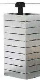
Pile de dix caisses de rangement en aluminium anodisé naturel. | 28 x h 8 x p 38 cm l'unité, design CP — RV, KGT, Util.