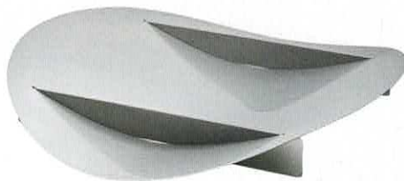
Bol en acier inoxydable. | 45 x h 6 x p 45 cm, Tension Bowl , Paul Coenen.