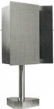
Lampe en laiton et acier. | 31 x h 56 x p 28 cm, design Pelle, Steel Tripp Table Lamp , Triode Design.