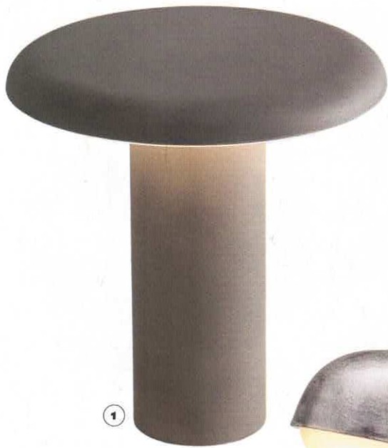
1. Lampe à poser en aluminium. \varnothing 18 \times h 19 cm, design Fosters + Partners, Takku , Artemide.