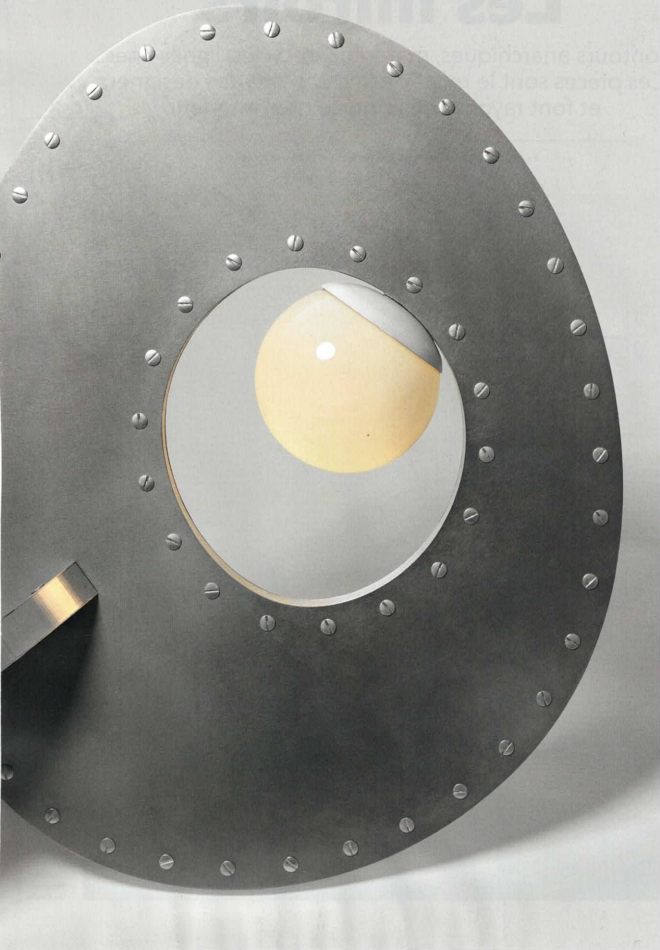
Lampe de table en aluminium et verre laiteux. 174 x h 58 x p 58 cm, design Rosie Li x Michael Yarinsky. Pebble , Rosie Li chez Triode Design.