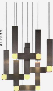
Suspension en verre opale et aluminium avec finition en argent brossé. Suspension in opal glass and aluminum with brushed silver finish. Design Lee Broom, Vesper Quattro Silver, 75,25 x 58,5 cm, LEE BROOM.