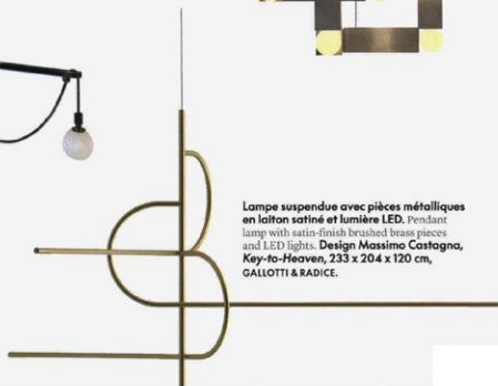
Lampe suspendue avec pièces métalliques en laiton satiné et lumière LED. Pendant lamp with satin-finish brushed brass pieces and LED lights. Design Massimo Castagna, Key-to-Heaven, 233 x 204 x 120 cm, GALLOTTI & RADICE.