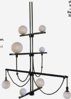
Lustre en acier plaqué, globes en verre soufflé bouche, corde en laiton. Chandelier with tiered, steel-plated frame, handblown glass globes and steel mesh cord with brass ball stop. Dada Chandelier, 157,4 x 111,7 x 86,3 cm, ATELIER DE TROUPE / TRIODE DESIGN.